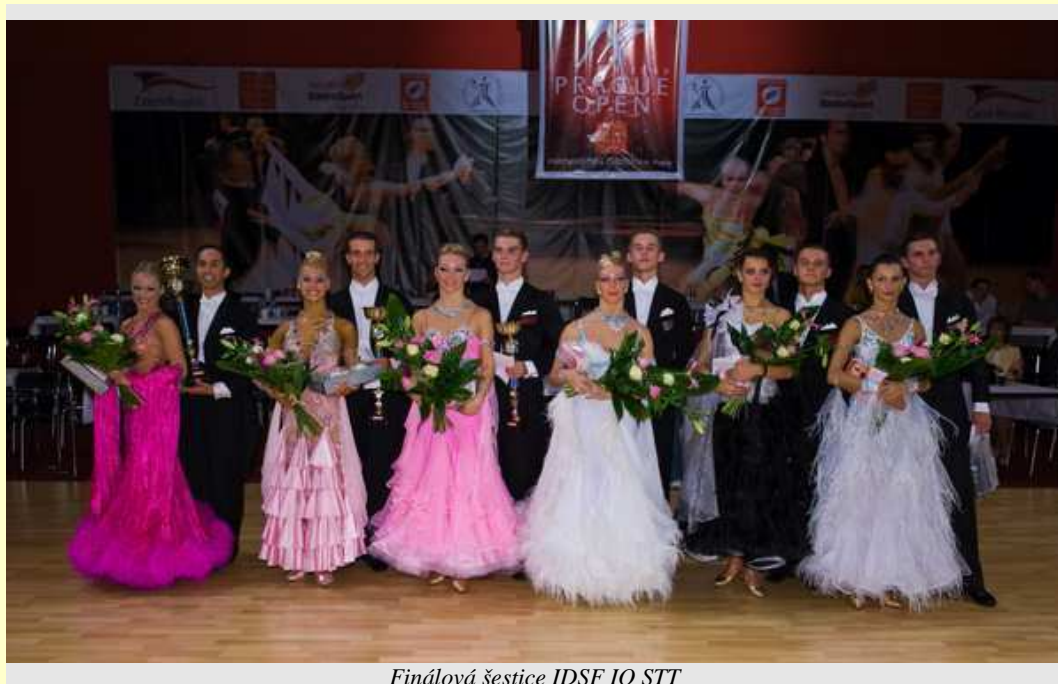
Finálová šestice IDSF IO STT