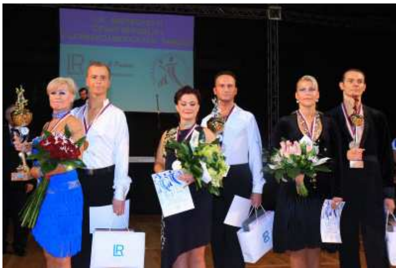
Stupně vítězů MČR LAT 2010 - Senioři

Nečekané množství přihlášek (celých sedm) způsobilo, že soutěž byla dvoukolová. Po prvním tanci prvního kola nebylo o finalistech nejmenších pochyb.