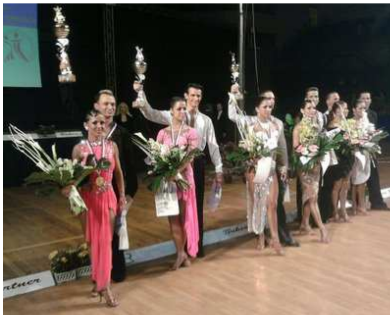
Finalisté MČR LAT 2010 - Dospělí