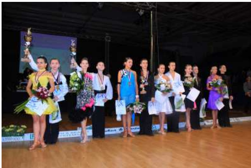
Finalisté MČR LAT 2010 - Junioři I