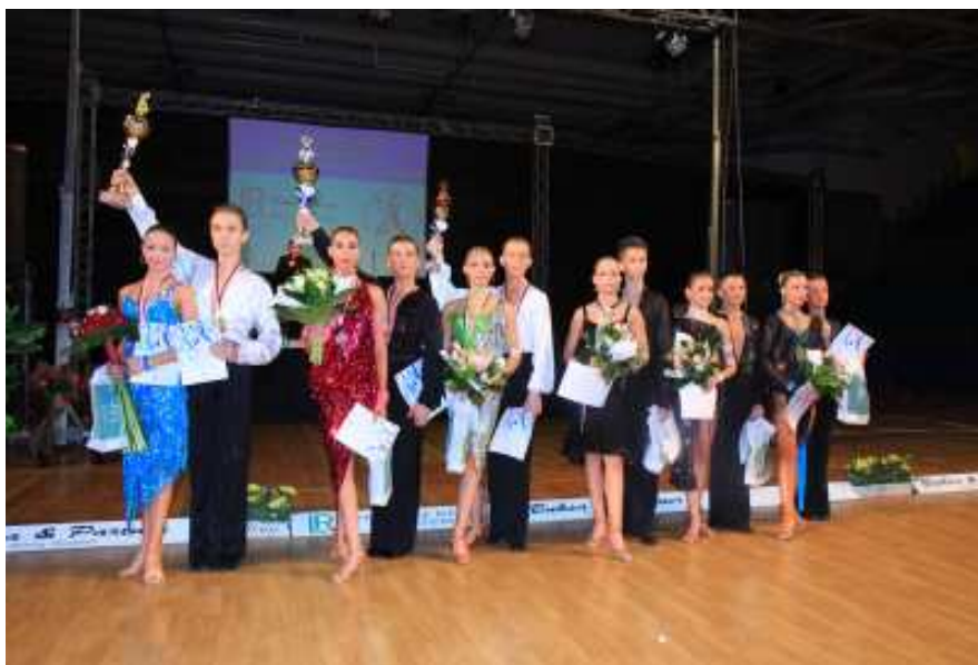
Finalisté MČR LAT 2010 - Junioři II